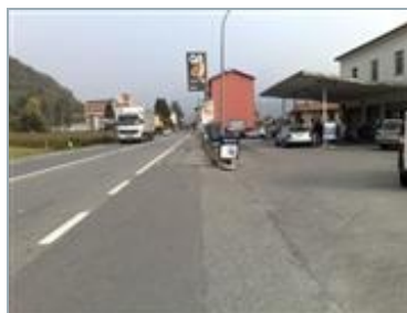
OLGIATE MOLGORA (LC) S.S. 36